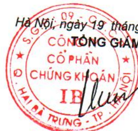
Nguyễn Văn Hạnh

01 02 03 04 05 06 07 08 09 10 11 12 13 14 15 16 17 18 19 20 21 22 23 24 25 26 27 28 29 30 31 32 33 34 35 36 37 38 39 40 41 42 43 44 45 46 47 48 49 50 51 52 53 54 55 56 57 58 59 60 61 62 63 64 65 66 67 68 69 70 71 72 73 74 75 76 77 78 79 80 81 82 83 84 85 86 87 88 89 90 91 92 93 94 95 96 97 98 99 100